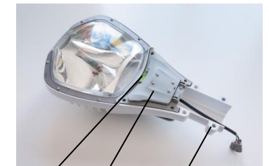
Рисунок 2. Схема установки светильника на кронштейн.